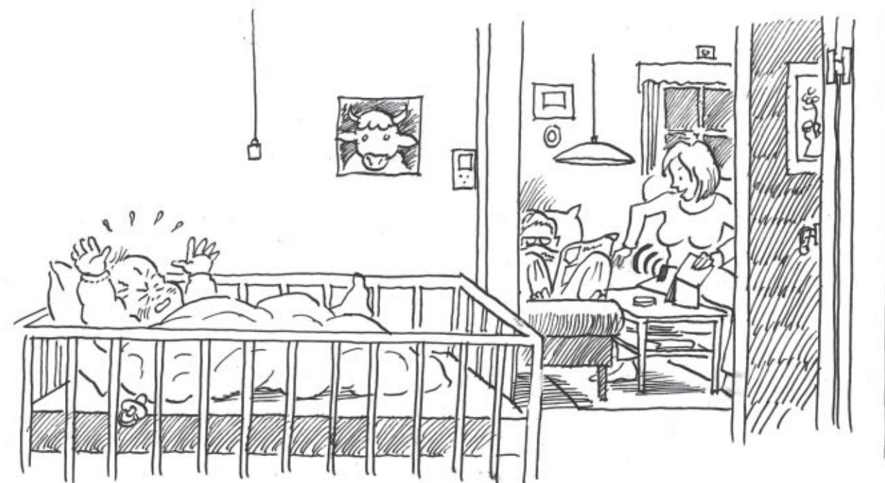
Babyalarmen kan tilsluttes lyskaldeanlæg eller som vibrator.

Til akutte situationer findes et nødkaldenummer: 80 80 33 11.